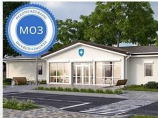
(Тип АМ) 1-2 лікаря (з житлом)