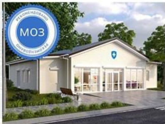
(Тип АМ) 1-2 лікаря (без житла)

Для будівництва планується застосувати типові проектами, розроблені Міністерством регіонального розвитку спільно з Міністерством охорони здоров'я