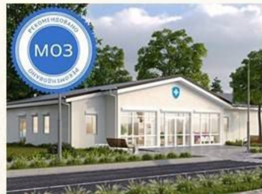
(Тип АГ) 3-4 лікаря (без житла)