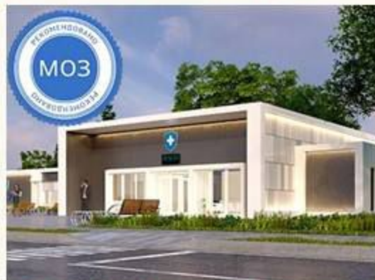
(Тип Ц) 5-7 лікарів (без житла)